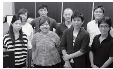
サイバーインテリジェンス スタッフ一同