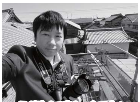
風が強くて寒かったです! (高い所は苦手です~)

どんなに腕の良い料理人でも、素材が悪ければ美味しい料理は作れません。それはホームページ制作でも全く同じことが言えます。どんなに素晴らしいウェブデザイナーでも、経験豊富なウェブコンサルタントでも、何も素材がなければ、なんの特長も無い空っぽのホームページしか作れません。だからこそ、ヒアリングが重要で写真集めに苦労しているのです。 今回、親子三代続く屋根瓦工事店のホームページを作ることにしたのですが、絵的に映える写真が無かったため、工事現場まで行って写真を撮ってきました。 職人らしさが伝わるかっこいい写真を手に入れるためなら、足場にも登ります!