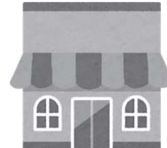
店舗改装 (不動産の購入・取得は不可)