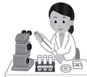
新商品の開発 (開発に必要な図書を購入)