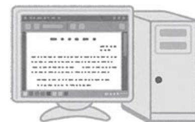
PC・ロボット等の 設備の導入